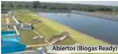
Abiertos (Biogas Ready)

Vinazas / Efluentes de fábrica / Cachaza